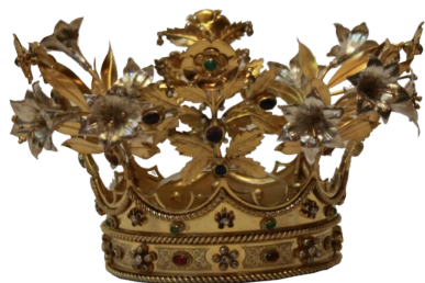
Couronne de Notre-Dame de Tongre offerte par les paroissiens en 1881.

La neuvaine de messes et de saluts se poursuivit avec ferveur et le dimanche 15 mai, dernier jour de neuvaine, une communion générale de réparation groupait 183 paroissiens. Réparation admirable, qui, nous n'en doutons pas, fit le plus grand plaisir au cœur de notre bonne Mère. Comme au Samedi-Saint, nous pouvons chanter « O felix culpa » « O bienheureuse faute » qui permit et provoqua une aussi belle réparation. En toute vérité, nous pouvons dire que la Vierge de Tongre a permis cet odieux sacrilège pour obtenir des prières nombreuses et ferventes. En semant l'émoi et le deuil dans les populations environnantes, ce sont les âmes qu'elle voulait atteindre; c'est son mois de mai qu'Elle voulait plus beau; ce sont des revirements et des