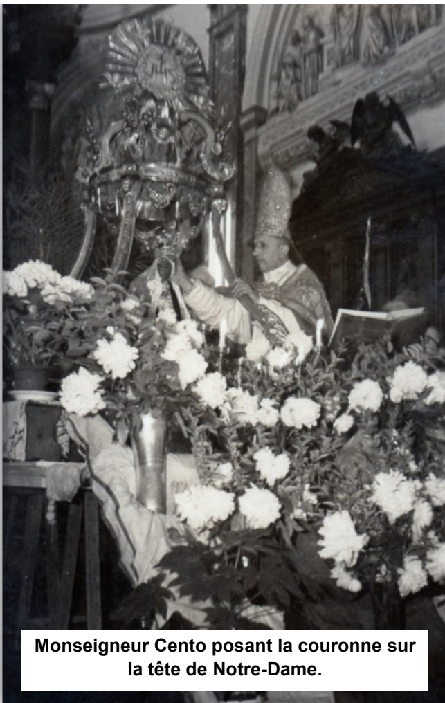
Monseigneur Cento posant la couronne sur la tête de Notre-Dame.

Une messe sera célébrée pour les pèlerins à la rentrée de la procession.